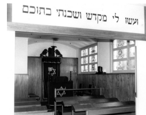
Sinagoga da União à rua Santa Alexandrina, Rio Comprido, Rio de Janeiro