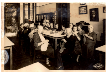
Grupo de senhoras reunidas no Lar dos Velhos da União, ainda na rua Alice 92, tricotando peças para enviar aos necessitados na Alemanha durante a Segunda Guerra Mundial (prov. 1942)